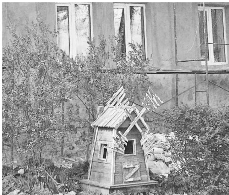
Поселок Думиничи, ул.Гостиная, д.22

Строители разглядели символ победы на территории ремонтируемого дома в Думиничах