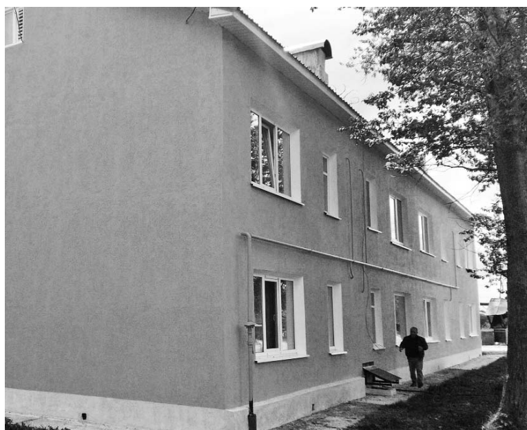
Село Брынь, ул.им.Полянской, д.5

Буква Z реально просматривается на мельнице, которая установлена как декоративный элемент на территории многоквартирного дома № 22 на улице Гостиной в посёлке Думиничи.